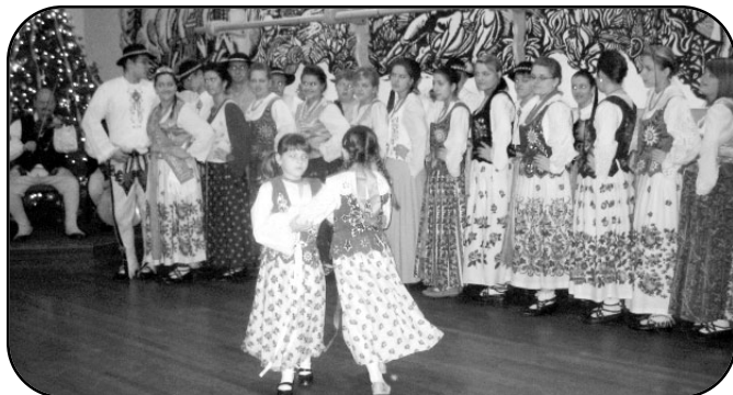
Występy zespołu góralskiego w czasie Wigilii Council of Educators in Polonia

poprawę. Pomimo wszystko, tkwi w nas wielka wiara, że wspólnymi siłami i zaangażowaniem będziemy budować siłę gospodarczą naszego kraju. Niech będzie to naszym wspólnym życzeniem, abyśmy nie dali się kryzysowi, abyśmy wierzyli we własne siły, a uda się nam osiągnąć to, czego nie udało się nam dokonać w poprzednim roku. Wszystkim Czytelnikom składamy najlepsze życzenia noworoczne, przede wszystkim zdrowia, szczęścia rodzinnego, sukcesów w pracy i dużo lepszej przyszłości!